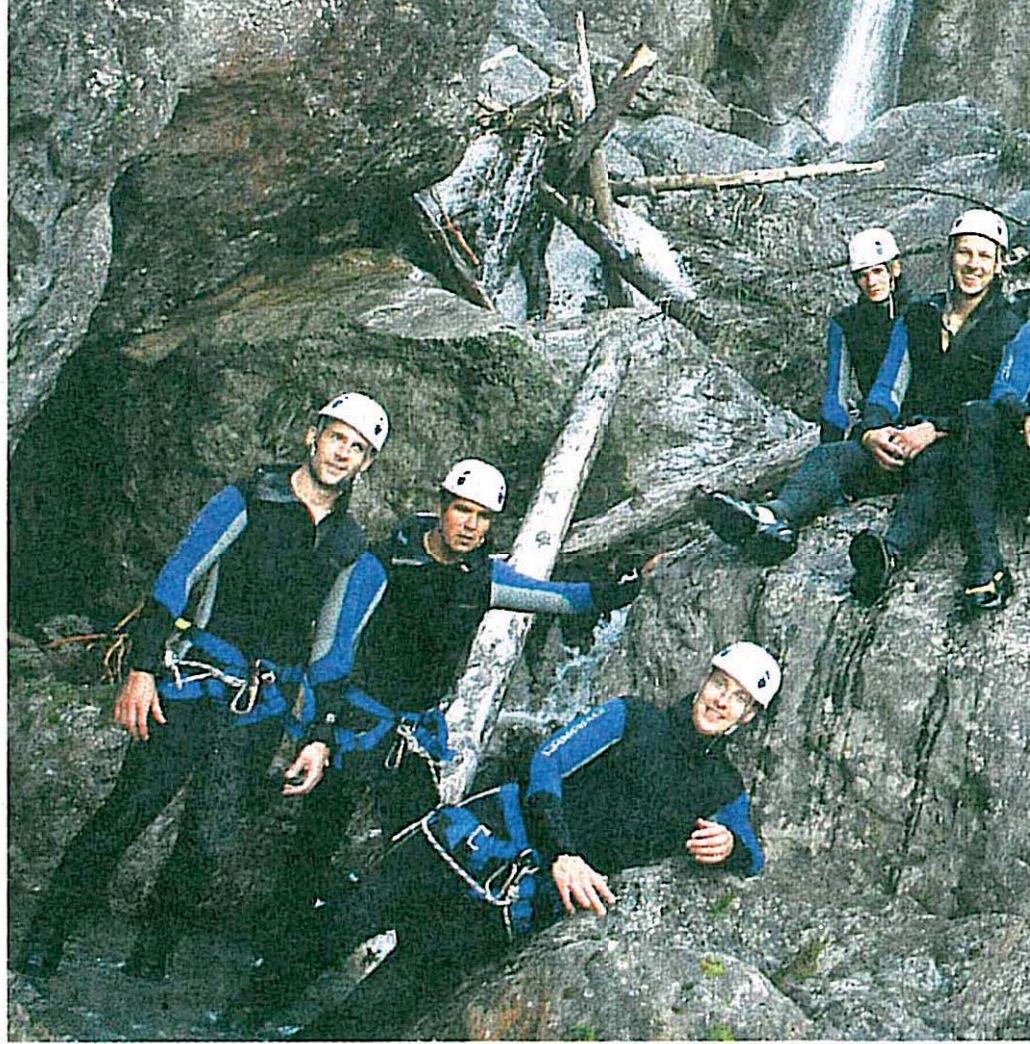
Gemeinsame Abenteuer für gemeinsame Aufgaben. Die KAC-Cracks bei