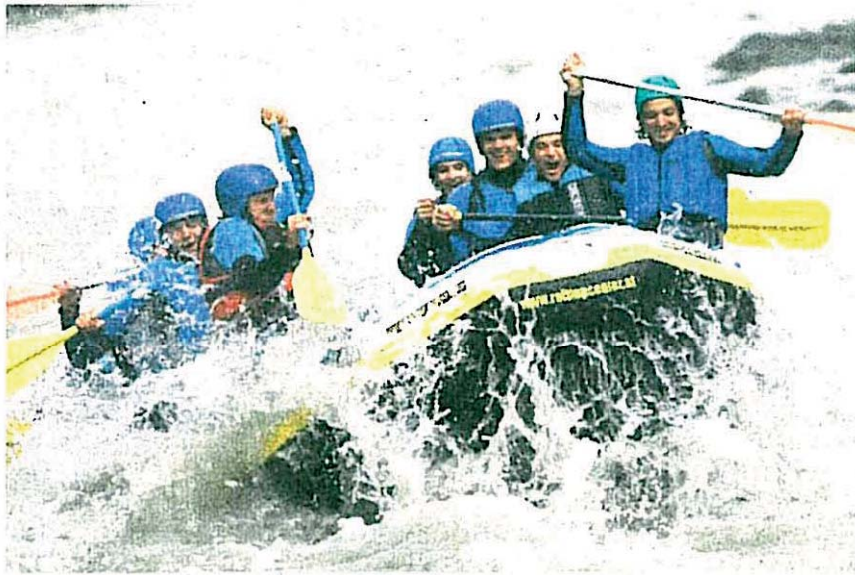
Eine Rafting-Tour zählte ebenso dazu ...